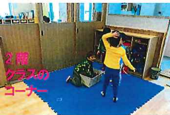
2階 クラスの コーナー