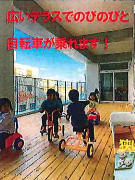
広いテラスでのびのびと 自転車が乗れます!