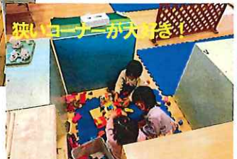
遊びコーナーが大変人気!