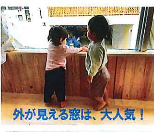
外が見える窓は、大人気!