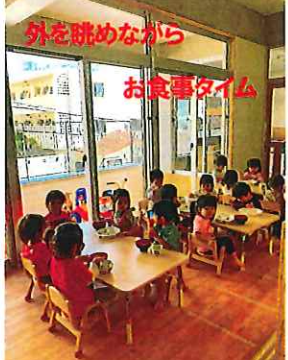
外を眺めながら お食事タイム