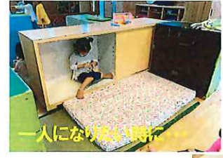
一人になりたがる時期