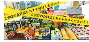
フードドライブ活動にご協力を!!

今年度もSDGsの一環として、「フードドライブ」の取り組みを行いたいと思います。 賞味期限が3か月以上ある食品 (お米、レトルト食品、缶詰、カップ麺、麺類、お菓子等)がありましたら寄付のご協力をお願いします。ご自宅で余っているものでよろしいです。集まりましたら那覇市社会福祉協議会へ寄付する予定です。