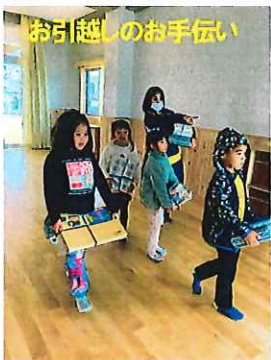
お引越しのお手伝い

さて、あっという間に2月。“逃げる2月”と言われるのが、年度末に向けて改めて保育を振り返る期間となります。子ども達の成長を保護者の皆様とともに喜び共有したいと思います。今後ともどうぞ宜しくお願いいたします。